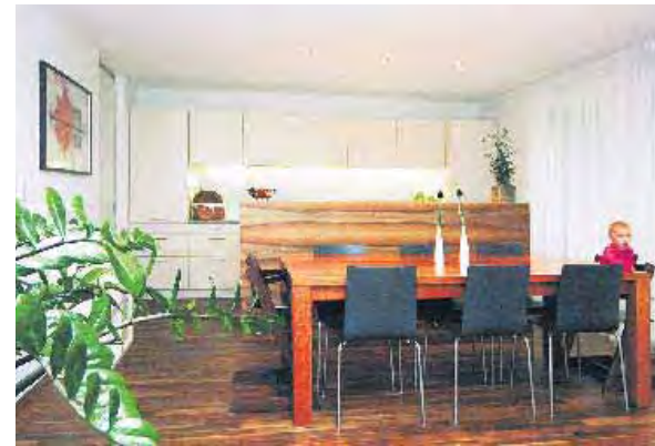
Treffpunkt: Im Mittelpunkt des Wohnraumes steht der Esszimmertisch.