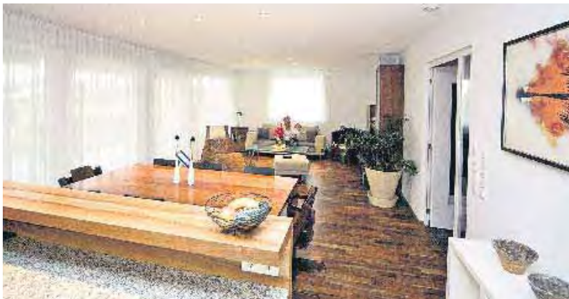
Der großzügige Wohnraum wird durch die raumhohe Südverglasung noch hervorgehoben.