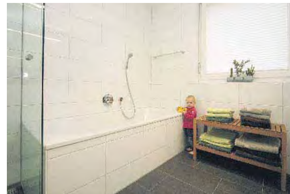
Die Badewanne wird von den Kindern gerne in Anspruch genommen.