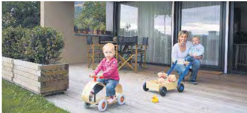
Die Terrasse mit angrenzendem Gartenanteil bietet genügend Platz für die Zwillinge zum Spielen.