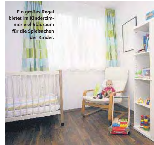
Ein großes Regal bietet im Kinderzimmer viel Stauraum für die Spielsachen der Kinder.